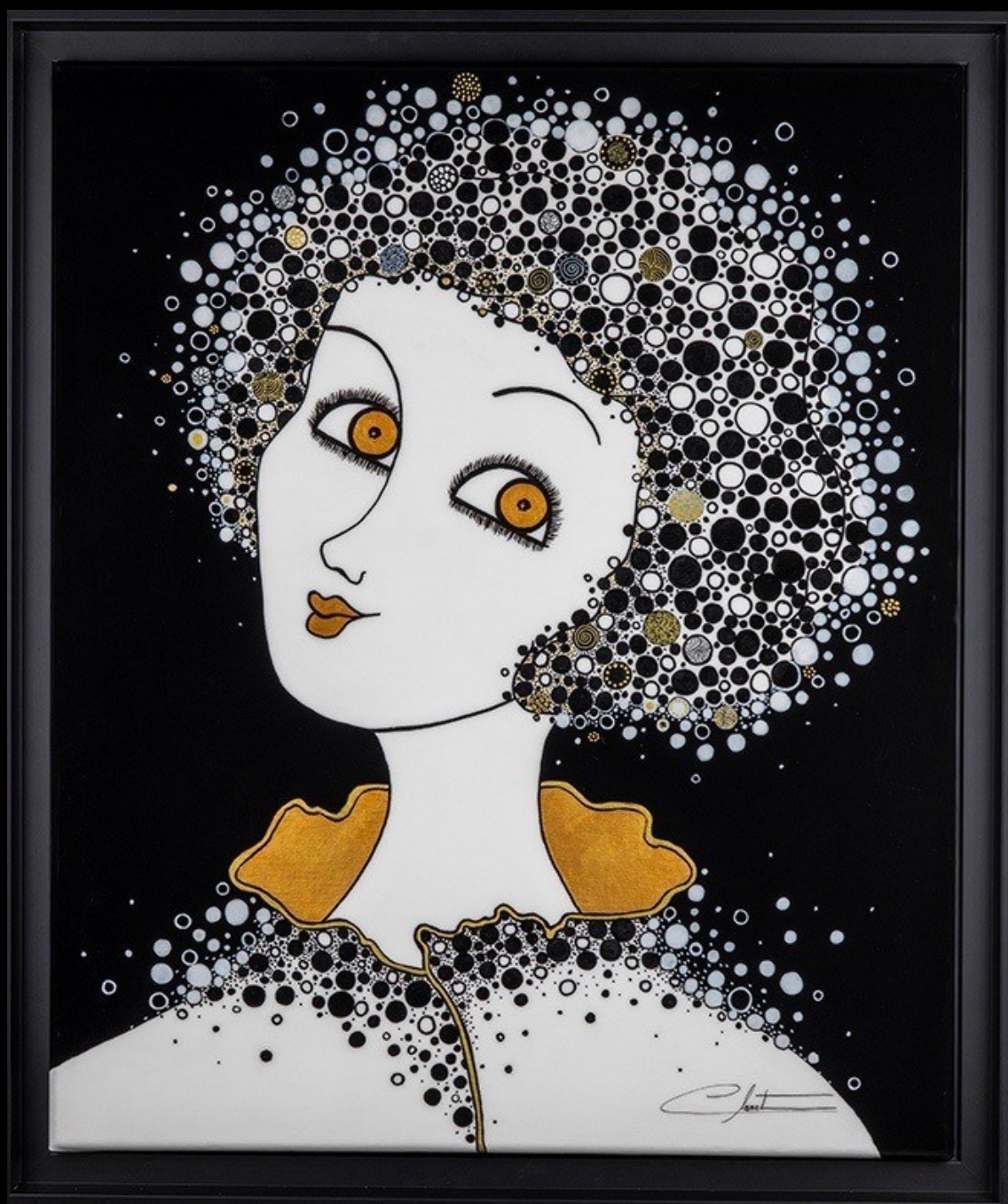
Apoline / 65 x 54 cm/ Acrylique laqué