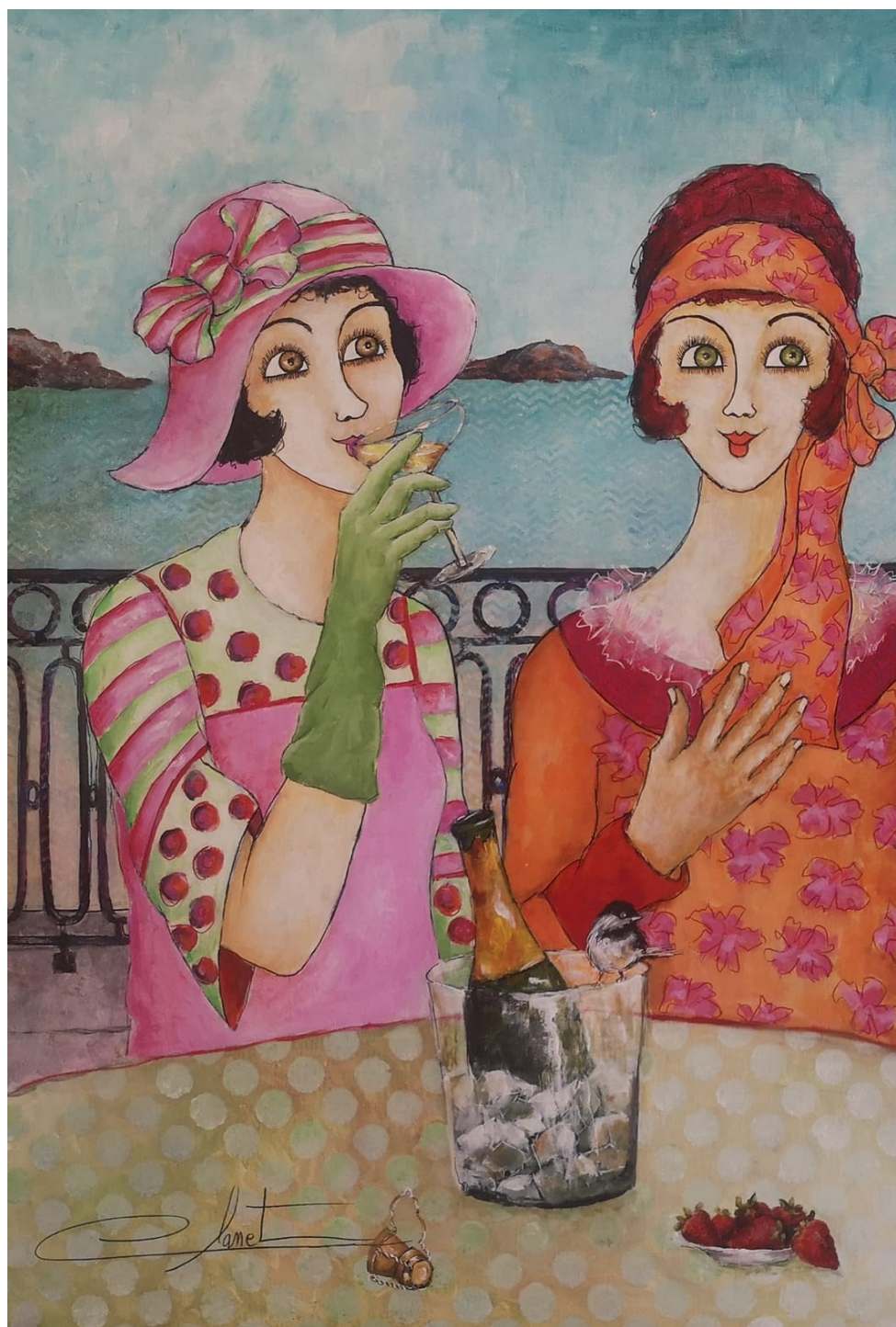
Fraise Pistache/ 89 x 116cm/ Acrylique