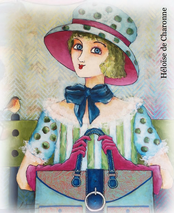
Héloïse de Charonne

Il gazouillait le plus fort possible la phrase qui fait mouche « l'oiseau en cage est comme les humains amoureux des espaces clos, il étouffe. L'oiseau doit pouvoir sortir de sa coquille et déployer ses ailes ».