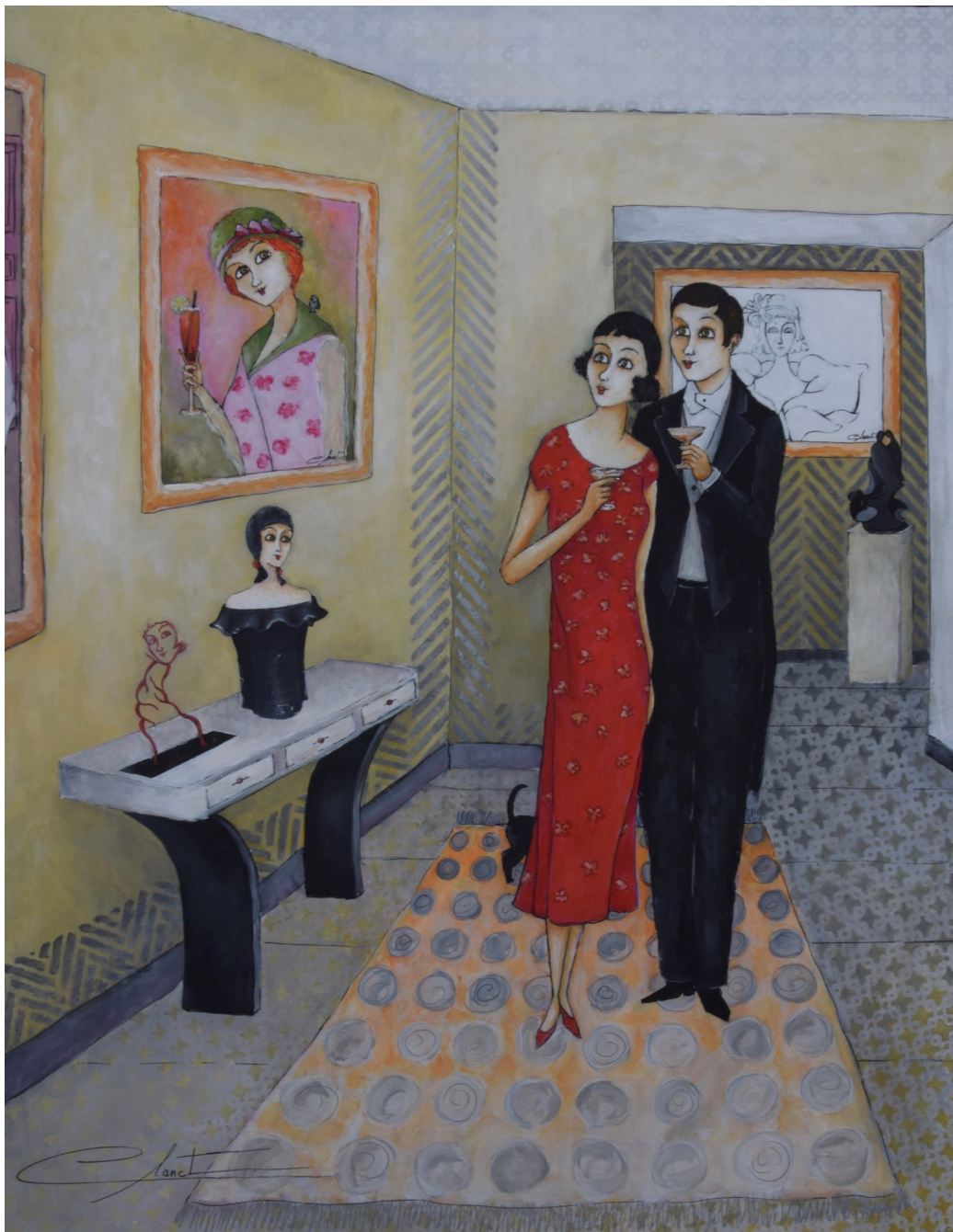
Soirée vernissage / 92 x 73 cm / Acrylique