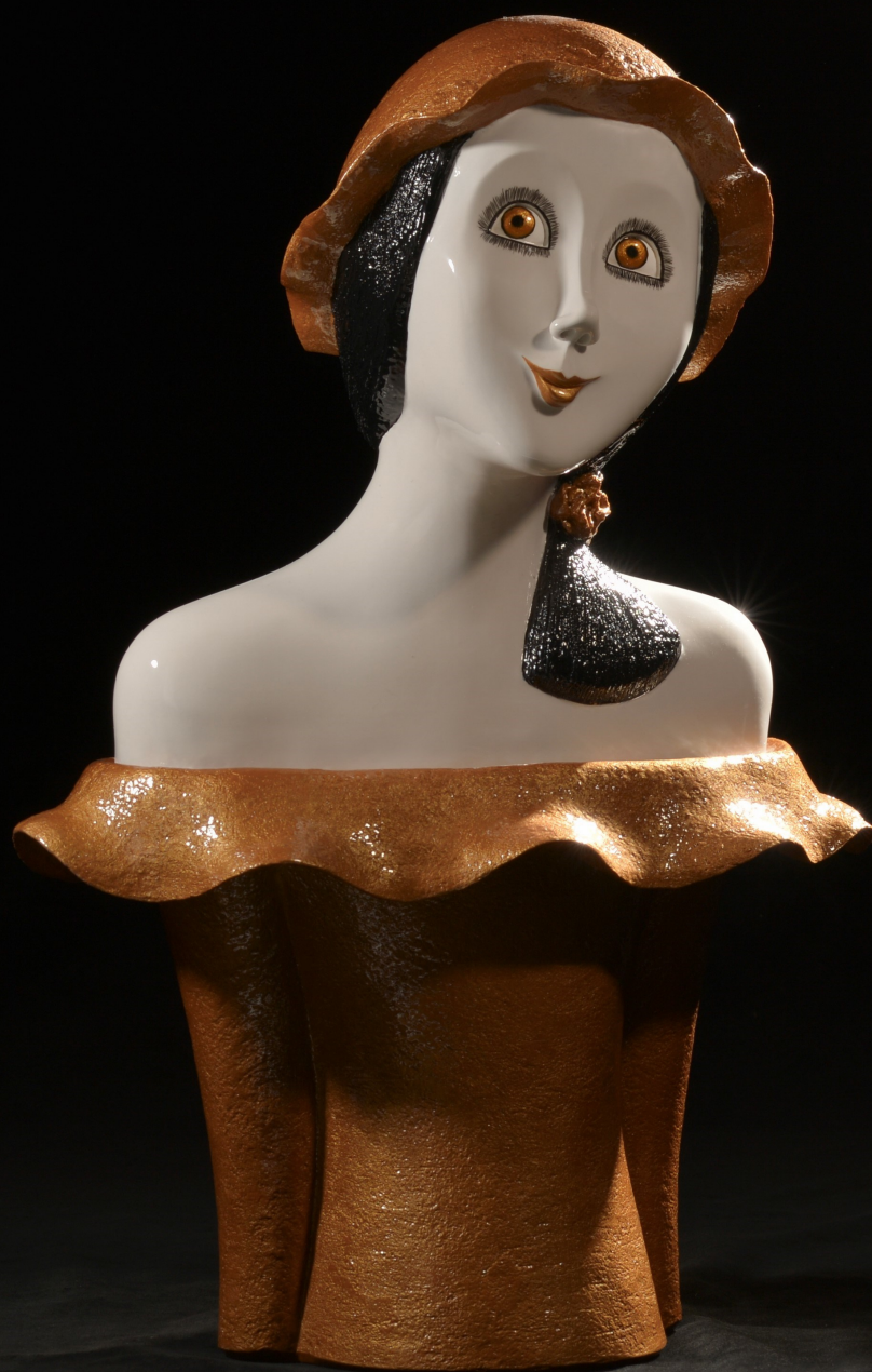
Nanou 2/8 / 40,5 x 32 x 20 cm/ Résine