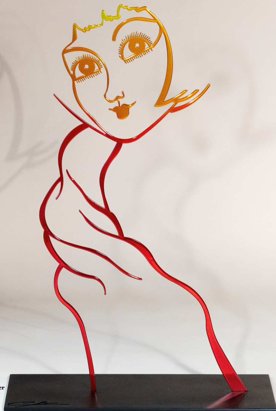
Miss Marie-Julie/ 150 x 20 x 100cm/ Acier