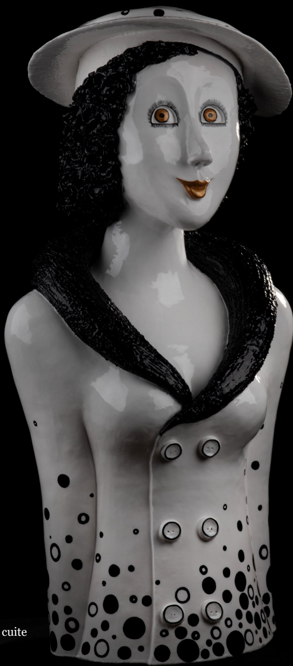
La Belle Gabrielle/ 60 x 28 cm/ Terre cuite