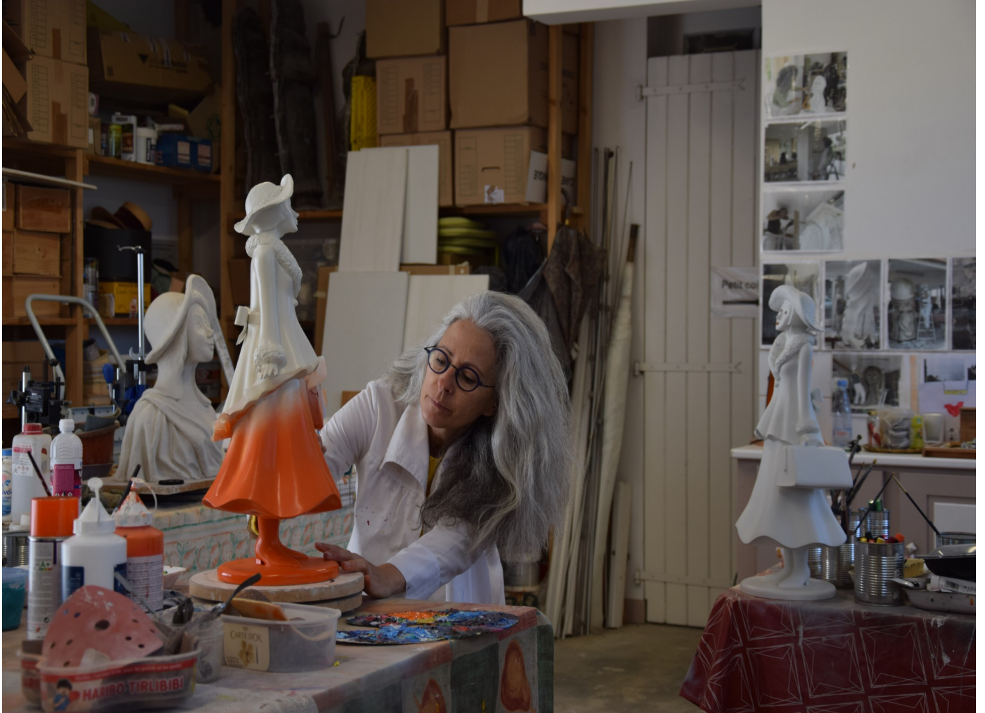
Atelier de l'Artiste