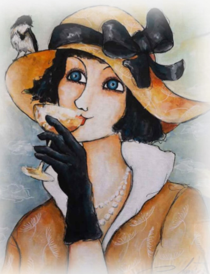
Miss Lisette/ 46 x 38 cm/ Acrylique

Charlotte de Montparnasse ? Montparnasse juste pour la tour, car notre tourterelle est enfermée dans une tour d'ivoire. Elle est toujours là, carré court, mais l'heure n'est pourtant plus à la fête.