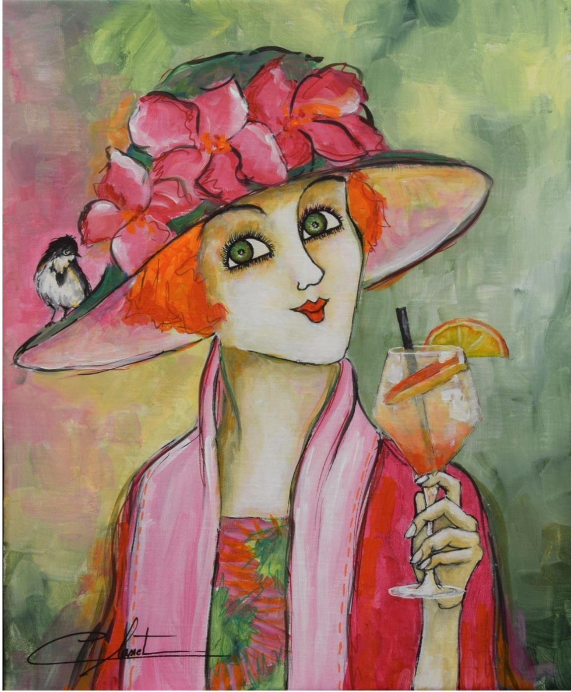
Cocktail / 46 x 38 cm / Acrylique