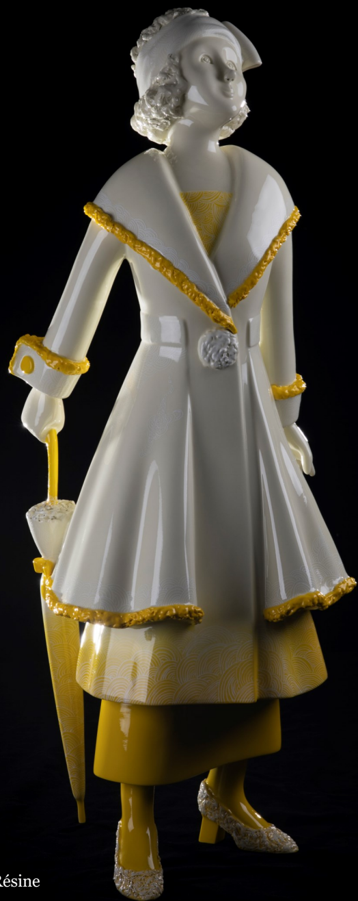
Petite Marie 4/8 /75 x 30 x 27 cm/ Résine