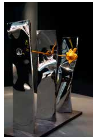
Philippe Gauberti IMPAKT 150 x 150 x 45 cm