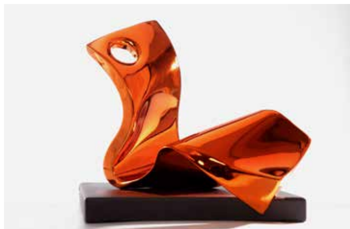
Philippe Gauberti ODALIBRE 36 x 26 x 15 cm