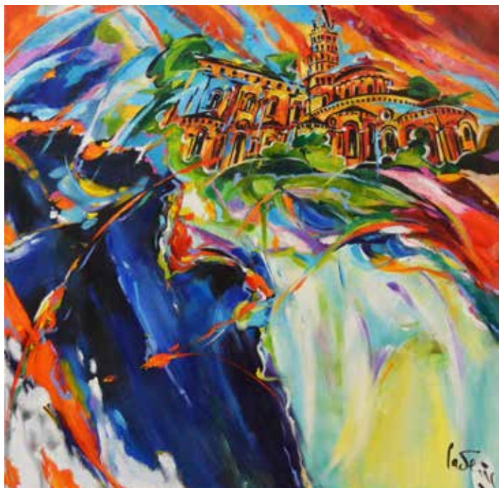
Bernard Cadène Saint-Sernin Toulouse 100 x 100 cm