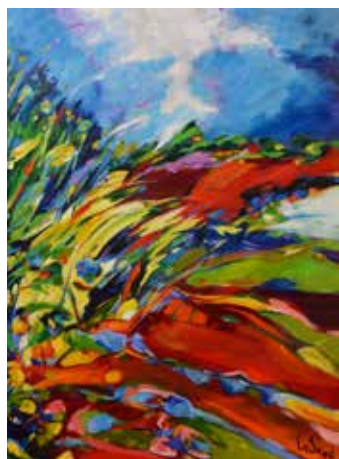
Bernard Cadène La folle nature 116 x 89 cm