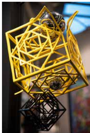
Philippe Gauberti ILLUPTIK 100 x 100 cm