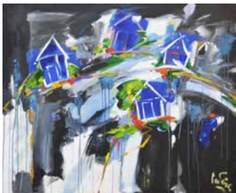
Bernard Cadène Tout bleu le village 40 F