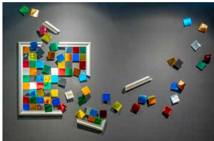
Philippe Gauberti ENVOL-ÉMOI 300 x 250 cm