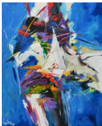
Bernard Cadène Le bateau dans la tourmente 81 x 65 cm